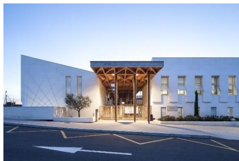
Groupe scolaire Opio (06) © Milène Servelle