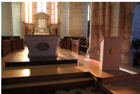
Création d'un autel et d'un ambon Charly-sur-Marne (02) ©Art et Créations