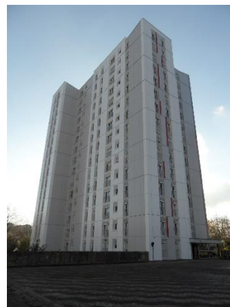
Requalification architecturale et thermique de deux tours de 206 logements collectifs Antony (92) ©Architecture Pélegrin